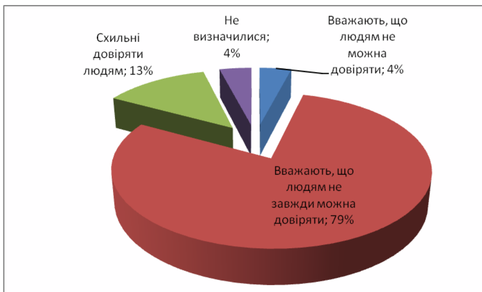
Рис. 1. Рівень генералізованої довіри студентської молоді

Як бачимо, схильні довіряти людям 13% респондентів, не довіряють – 4% респондентів. Тобто рівень генералізованої довіри перевищує рівень генералізованої недовіри. Більшість студентів (79%) дотримуються думки, що людям не завжди можна довіряти.