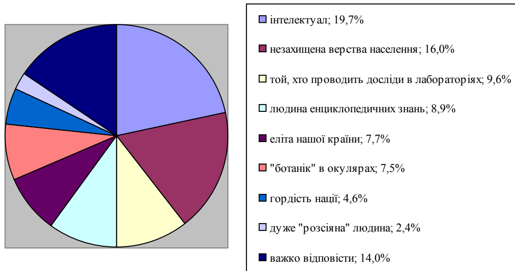
Рис. 1. Соціальні стереотипи стосовно образу вченого в сучасному українському суспільстві (у % до кількості опитаних)

Суспільство також стигматизує, формує певний набір стереотипів щодо уявлень про те, яким має бути вчений, науковець. Для прикладу, розглянемо дослідження, проведене у ВНЗ та НДІ Дніпропетровської області, метою якого було виокремити чинники, що впливають на мотивацію наукової діяльності вчених, створити соціальний портрет вченого. Загальна кількість респондентів становила 1118 осіб, з яких молоді вчені – 556 [10] (рис. 1).