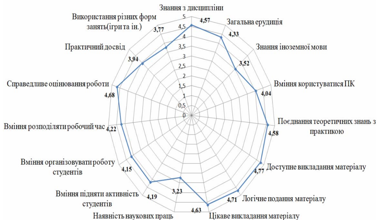
Рис. 2. Необхідність наявності основних професійних характеристик у викладачів університету, на думку респондентів (представлена у вигляді індексу, що змінюється від 1 до 5, де 1 – характеристика не повинна бути ні в якому випадку, 5 – повинна бути обов’язково)

кладати матеріал (4,77), подавати його логічно, послідовно та обґрунтовано (4,71), а також справедливо оцінювати роботу студентів (4,68). Важливими для студентів також є вміння цікаво викладати матеріал (4,63), вміння поєднувати теоретичні знання з практикою (4,58) та глибокі знання з дисципліни, що викладається (4,57) (рис. 2).