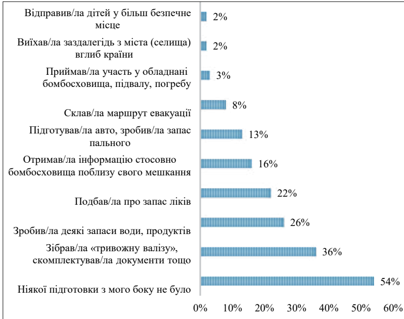
Рис. 1. Як готувалися респонденти особисто до початку воєнних подій (кількість відповідей не було обмежена)

Як засвідчили перші дні війни, ніякого плану для цивільних не існувало, і сім'ї самостійно приймали стратегічні рішення, як вижити у горнилі терористичної навали. Більшість респондентів, як демонструють результати опитування, нічого не робила в плані підготовки до війни (див. рис. 1).